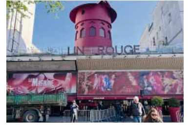
El mítico cabaret francés.

Vuelven a girar las aspas del Moulin Rouge