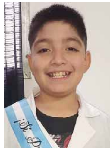
Junto a su madre. El niño regresaba de un club de fútbol.