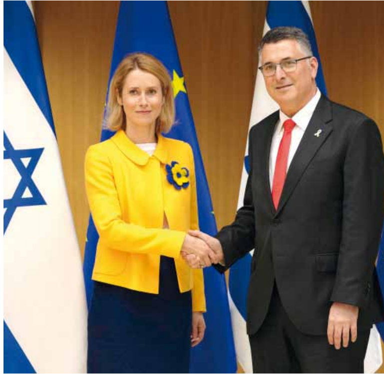
Encuentro fructífero. La jefa de la diplomacia de la UE, Kaja Kallas, junto al mini Exteriores de Israel, Gideon Saar.

El portavoz comunitario Anouar El Anouni dijo durante la rueda de prensa diaria de la Comisión Europea que este acuerdo es “resultado del diálogo” iniciado por Kallas con el ministro israelí de Exteriores, Gideon Saar, en lí-