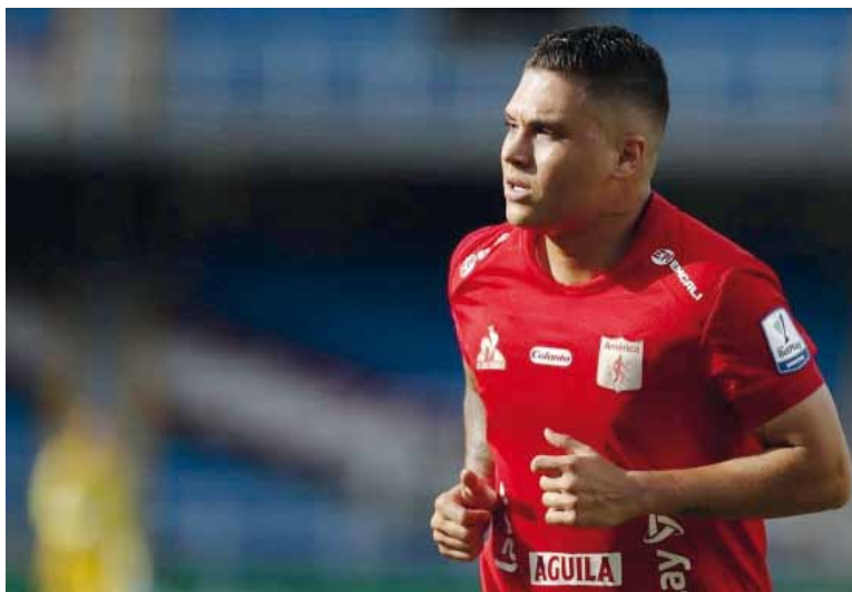
Regreso. El volante colombiano tendrá su tercera etapa en el equipo que conduce Marcelo Gallardo.

En River se daba por descontado que el jugador lograría desvincularse sin costo, al punto que ya se analizaban alternativas para liberar un cupo de extranjeros. Sin embargo, la intervención de los abogados de América de