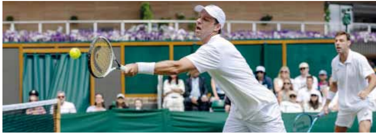
Sin final. Zeballos y Granollers eliminados.

Amanda Amisimova (13°) dio la gran sorpresa y venció a la bielorrusa y número 1 del mundo, Aryna Sabalenka, para meterse en la final. Su rival en el partido decisivo será la polaca Iga Swiatek (8°), quien irá en busca de su sexto título de Grand Slam.