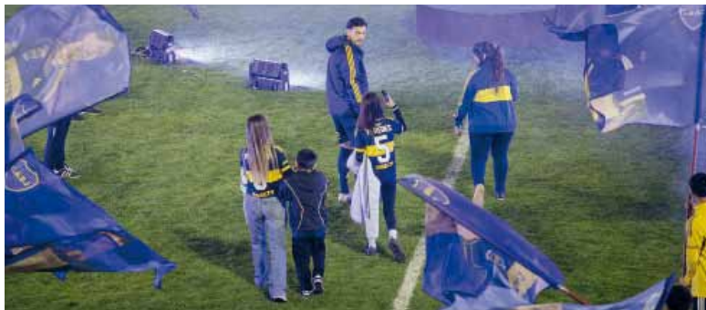
Acompañado. La familia del número 5 presente en su regreso.

Sobre Boca como institución remarcó: “Encontré el club muy cambiado, ha mejorado muchísimo en todo sentido. El predio está espectacular y acá las instalaciones han cambiado también. Con mis compañeros los vi, pero no tuve la oportunidad de hablar con muchos”.