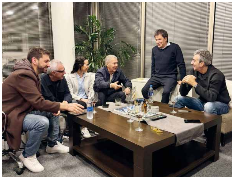
Vía del centro. Schiaretti, Manes y Randazzo apuestan al "medio".

La UCR, en sus dos variantes internas, acordó con el sector nucleado en torno a Emilio Monzó, al gobernador cordobés, Juan Schiaretti, aliado con el sector de