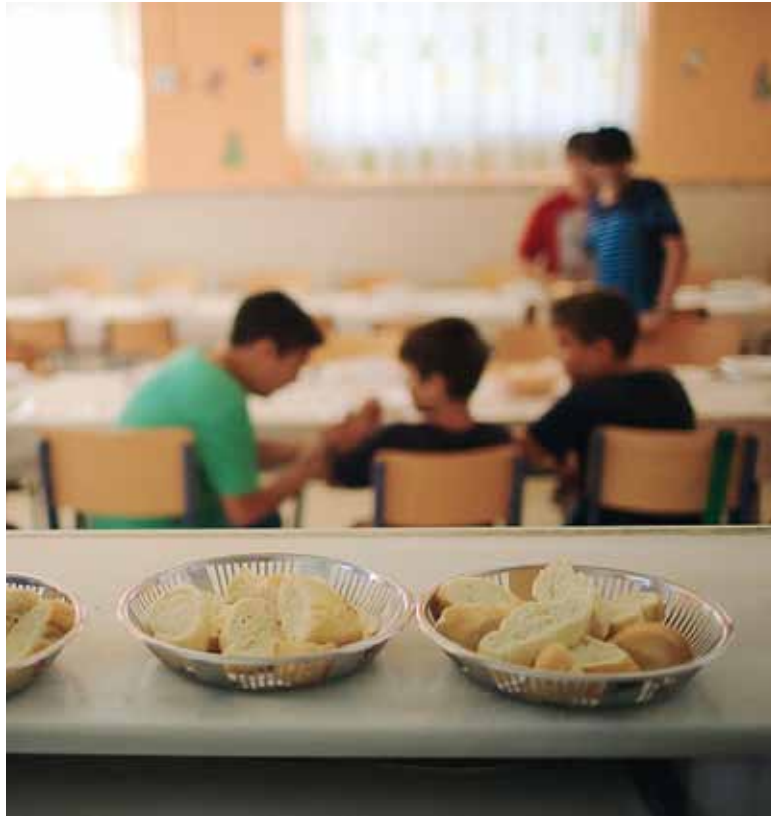
Problema acuciante. Un grupo de niños en un comedor.

tos de la Encuesta de la Deuda Social Argentina (EDSA) durante el período 2010-2024, revela una tendencia sostenida al alza, con picos alarmantes en los años 2018, 2020 y 2024. En el último año, ya bajo la administración de Javier Milei, el 35,5% de niños/as y adolescentes (4,3 millones) atravesó inseguridad alimentaria (IA), y el 16,5% IA severa.