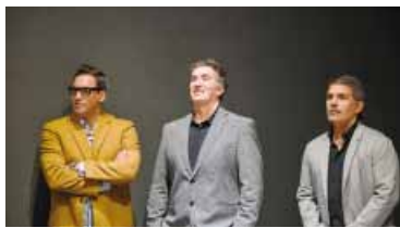
Federico Beligoy, director nacional de Arbitraje.

El arbitraje argentino implementará nuevas medidas en el Clausura