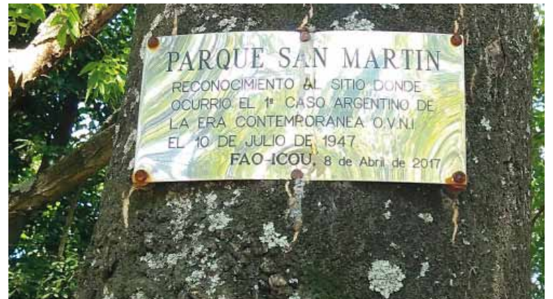
Recuerdo. La placa que colocó la FAO en el parque platense.

Es una iniciativa de ufólogos platenses, porque ese día se vio el primer ovni en Argentina, en 1947.