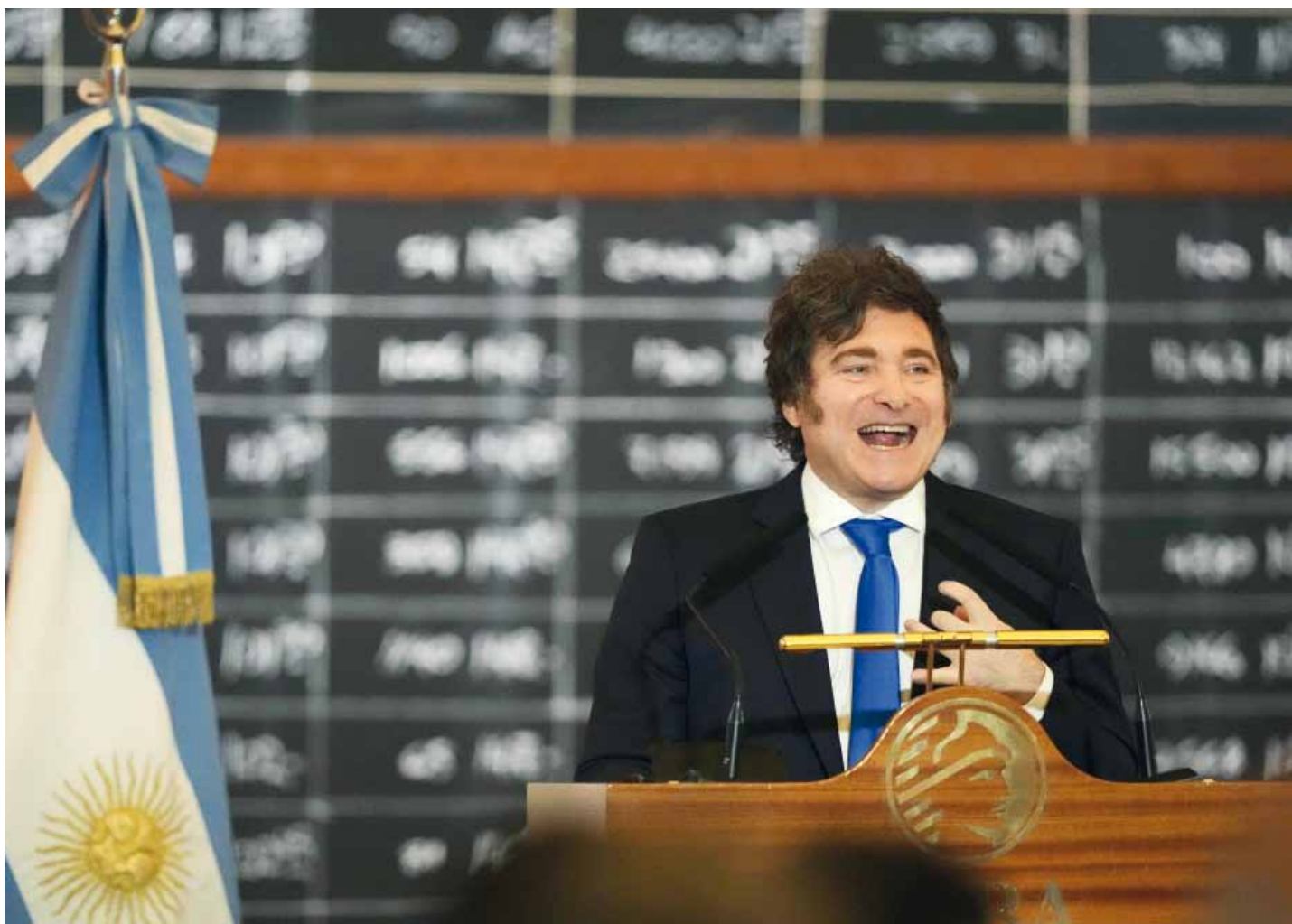
■ "La vida tiene riesgos, y hay que enfrentarlos", señaló el mandatario en el marco del 171° aniversario de la Bolsa de Comercio de Buenos Aires.

Uno de cada 3 chicos no tiene su comida diaria garantizada