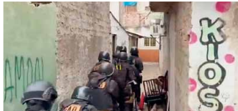
Tentativa de homicidio. Los procedimientos se realizaron en el marco de un presunto ajuste de cuentas.

La Policía desplegó varios operativos en villa Las Antenas y ocho delincuentes quedaron detenidos.