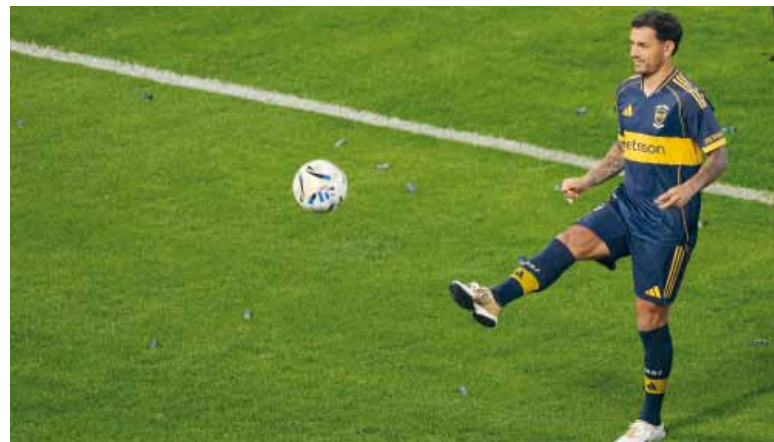
Volver al primer amor. Paredes pisa el césped de la Bombonera.

Por su parte, Cintia Spadavecchi, completamente vestida con los colores azul y oro, dijo: “No pensaba que Paredes se iba a animar a volver, pero esto parece un sueño. Ojalá le dé más dinamismo al equipo”.