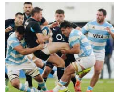
El seleccionado argentino de rugby buscará revertir su imagen.

Los Pumas con equipo confirmado para la revancha con Inglaterra